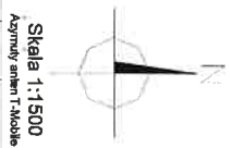
Skala 1:1500 Agnosty anteny T-Mobile