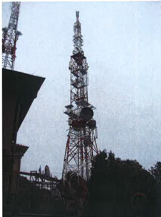
ZaŃ. nr 1: Widok ogólny instalacji radiokomunikacyjnej.