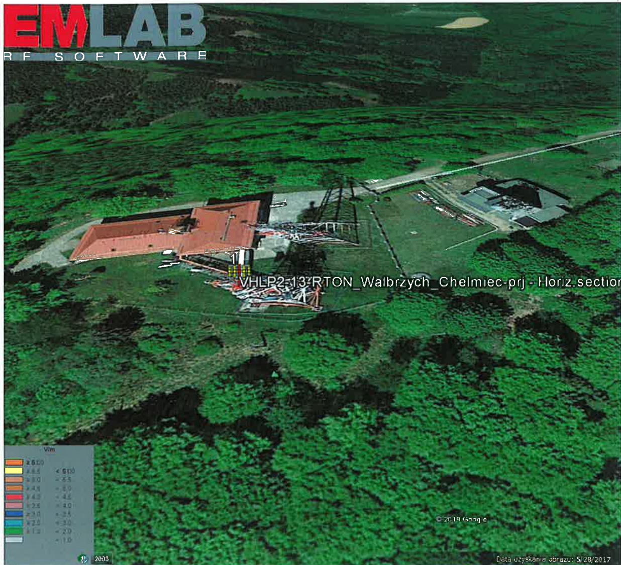
Rys. 2. Rzut poziomy rozkładu pola elektromagnetycznego anteny nowo projektowanej linii radiowej w otoczeniu RTON Wałbrzych Chelmiec przewidzianej do zainstalowania na wysokości 45 m nad poziomem terenu.