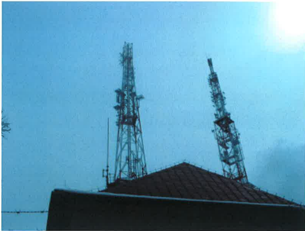
Fot. 1. RTON Wałbrzych Chełmiec – widok obiektu