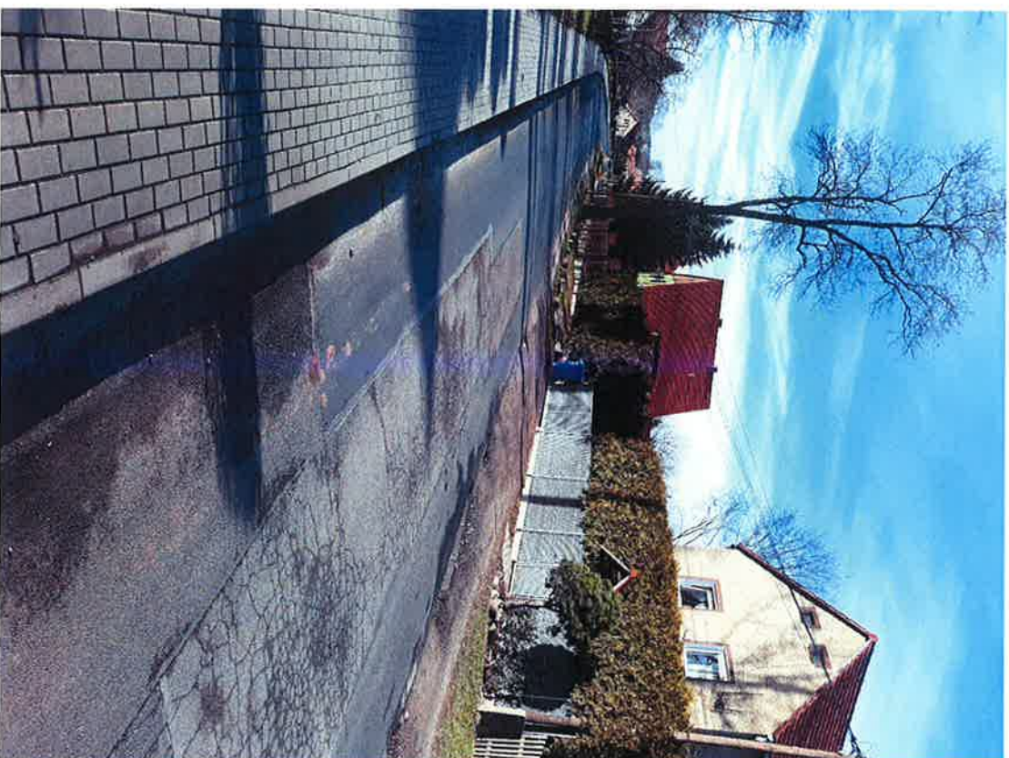
Załącznik nr 2. Proponowana lokalizacja przejścia dla pieszych