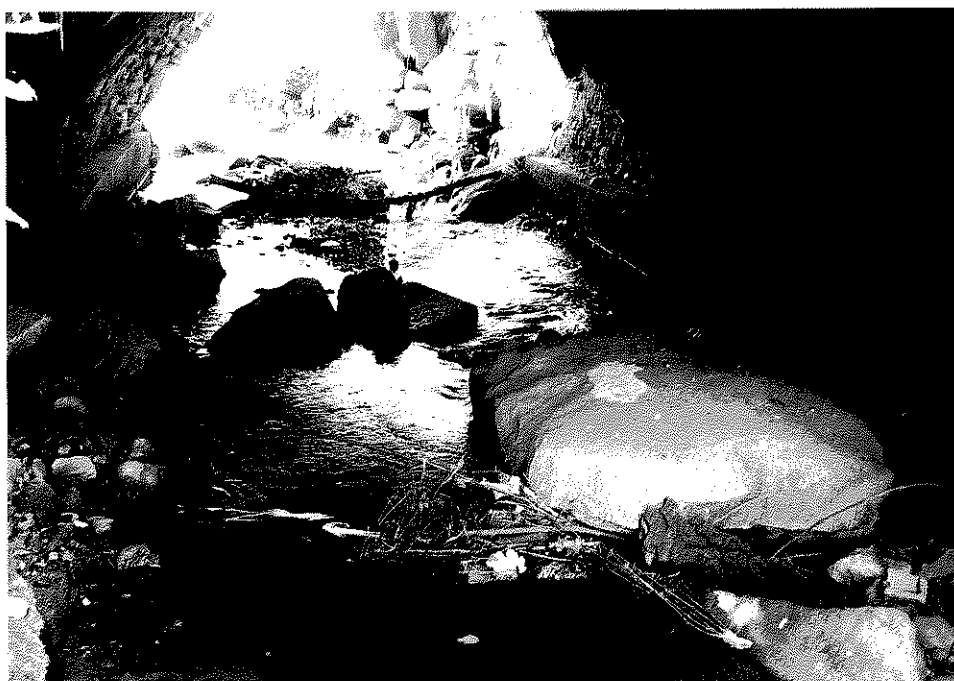
Rys. nr 19. Widok ogólny od strony górnej wody przestrzeni podmostowej. Widoczne duże kamienie zalegające w korycie rzeki.