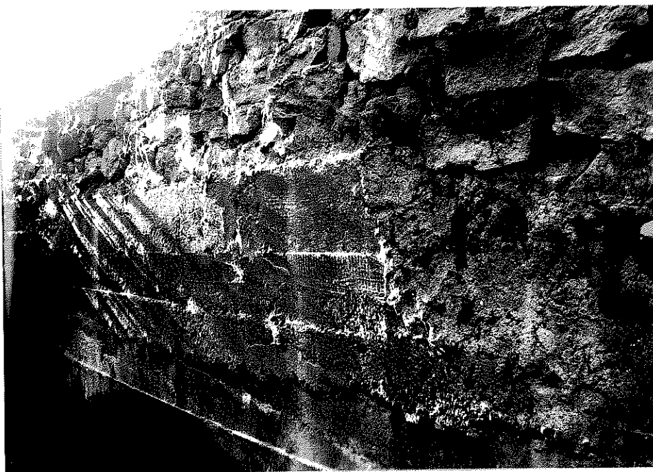
Rys. nr 14. Widok szczegółowy od strony górnej wody ściany czołowej (widok w kierunku Koła).