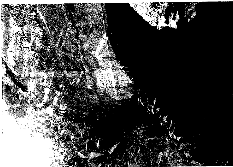
Rys. nr 12. Widok szczegółowy od strony górnej wody sklepienia i ściany czołowej usytuowanych nad lewym przyczółkiem.