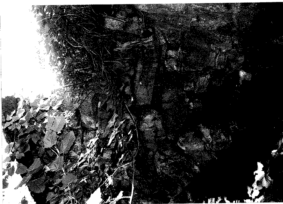
Rys. nr 29. Widok szczegółowy od strony dolnej wody sklepienia i ściany czołowej nad lewym przyczółkiem. Widoczny brak spoin pomiędzy elementami kamiennym.