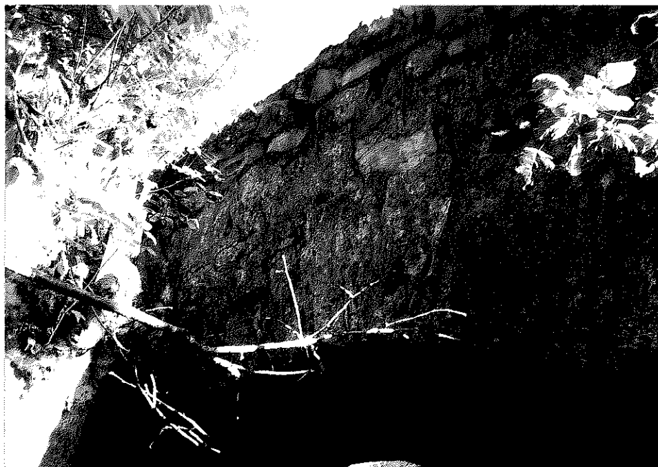
Rys. nr 27. Widok ogólny od strony dolnej wody kamiennego sklepienia i kamiennej ściany czołowej.