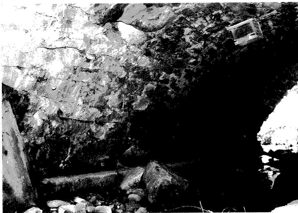
Rys. nr 17. Widok ogólny od strony górnej wody kamiennego sklepienia nad lewym przyczółkiem. Widoczne zawilgocenia skrajnych części sklepienia.