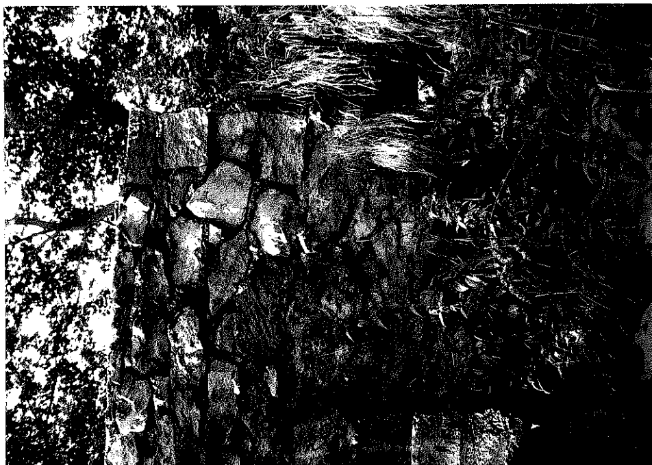
Rys. nr 16. Widok szczegółowy od strony górnej wody zakończenia kamiennej ściany czołowej nad prawym przyczółkiem. Widoczne niewypelnione spoiny pomiędzy elementami kamiennymi.