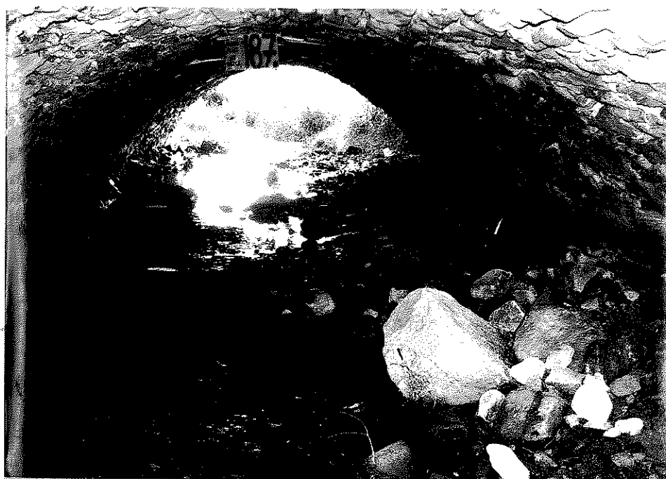
Rys. nr 11. Widok ogólny od strony górnej wody spodu sklepienia i przestrzeni podmostowej.