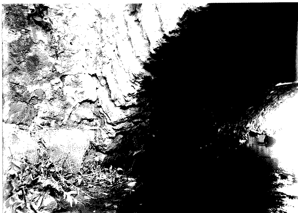
Rys. nr 9. Widok szczegółowy od strony górnej wody kamiennego sklepienia w węzłowie nad lewym przyczółkiem.