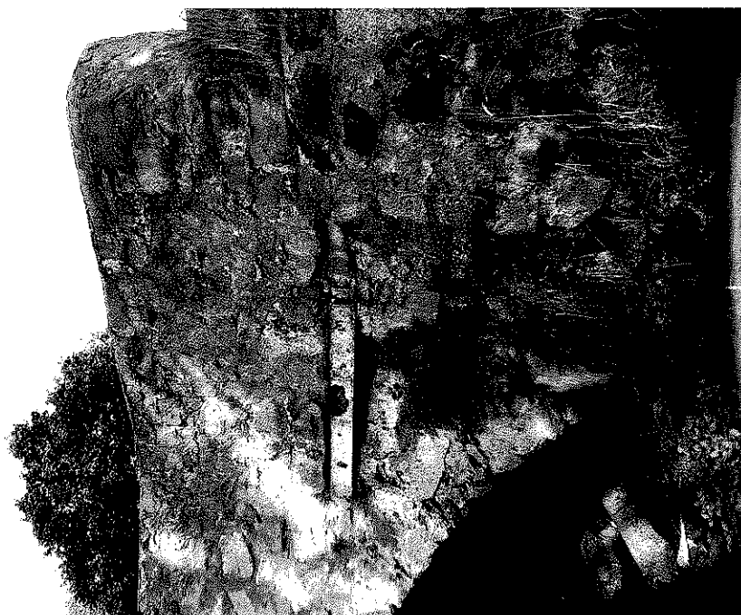
Rys. nr 18. Widok szczegółowy od strony dolnej wody kamiennego sklepienia i kamiennej ściany czołowej nad lewym przyczółkiem. Widoczna roślinność porastająca pomiędzy elementami kamiennymi. Widoczne również wzmocnienie ściany czołowej za pomocą stalowego elementu