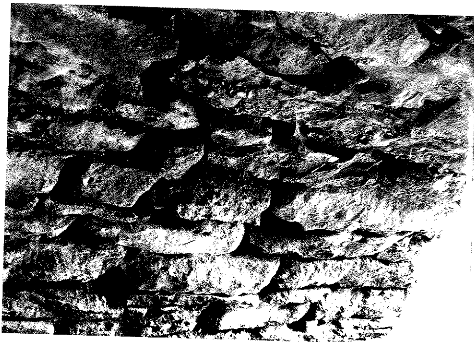
Rys. nr 23. Widok szczegółowy od strony dolnej wody skrajnej części sklepienia w kluczu. Widoczne bardzo duże ubytki spoin pomiędzy elementami kamiennymi.